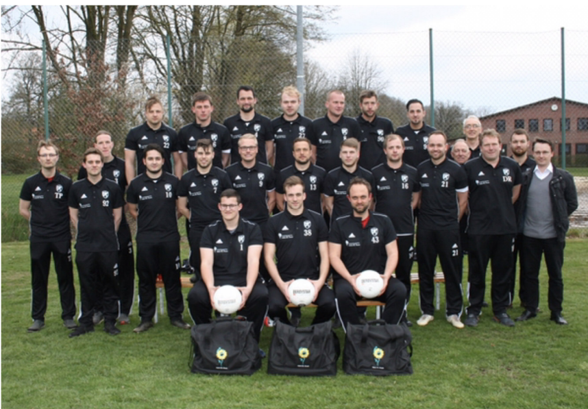
Heilpädagogisches Heim Dr. Kruse, Stellichte